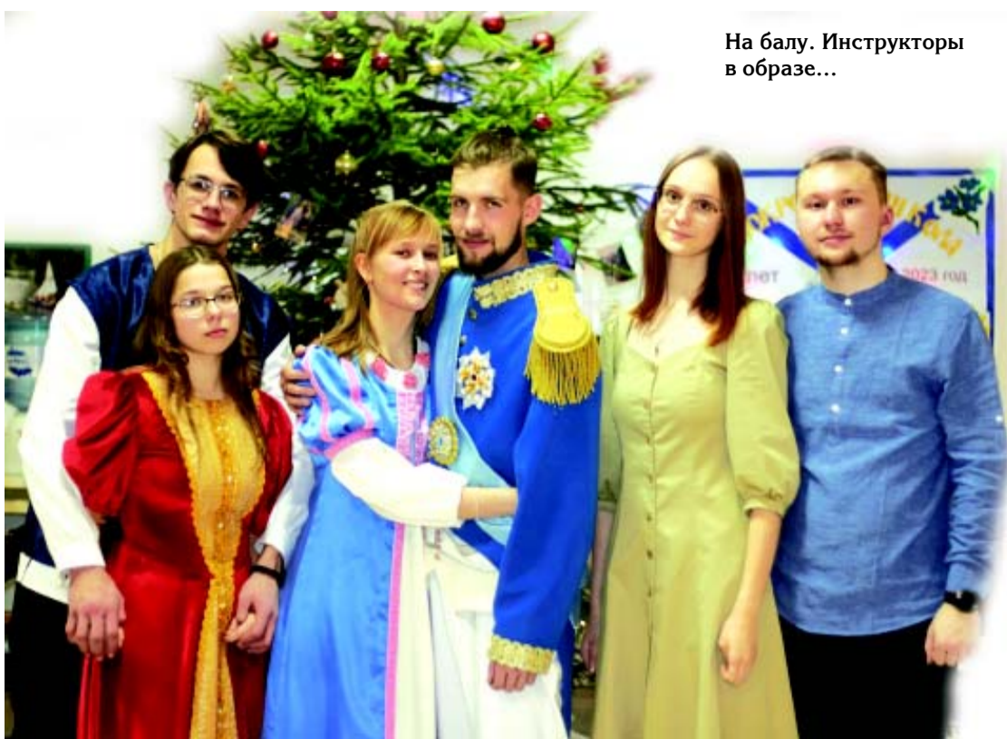
На балу. Инструкторы в образе...

2 января у нас был рыцарский турнир. Все было сделано в средневековом стиле. А 3 января к нам в лагерь в 10 часов приехало дошкольное отделение и отделение Следопытов – начальная школа. Для них была проведена игра по станциям. Они со-