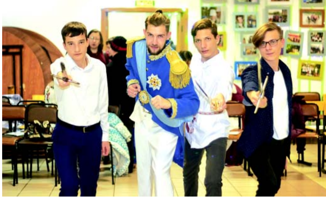
Перед рыцарским турниром

Казанскую, мы ездили в посёлок Лесной Мещовского района, станция Домашовка. Впервые там побывали. Отец Георгий Лоб принял нас дивным образом. У него там выстраивается музейно-выставочный трапезный комплекс и большой храм в честь преподобного мученика Кукши. Батюшка согласился принять такую ораву – нас было сто человек. Храм святого Кукши ещё недействующий. Этот строящийся храм в посёлке Лесном очень понравился. Он действительно окружён лесом. А рядом стоит маленький