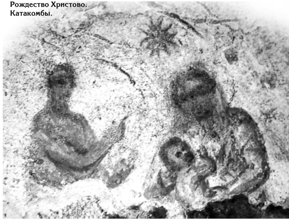
Рождество Христово. Катакомбы.

ду людьми» (Вар. 3:38). Интересно, что пророк о будущем пишет как о прошедшем.