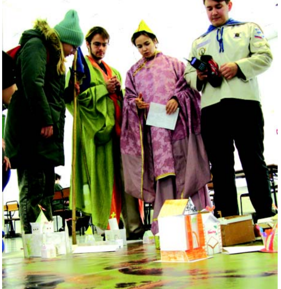
Эксперты оценивают ход строительства города Радушия

Наш лагерь в посёлке мы назвали: «По стопам святого мученика Кукши». Мы и про Кукшу много говорили, и про вятичей. Мы рассказывали о том, как святой Кукша просвещал вятичей. Эта тема очень нужна, потому что это – наш апостол, это – наша культура и наши корни. Вятичи имели особую