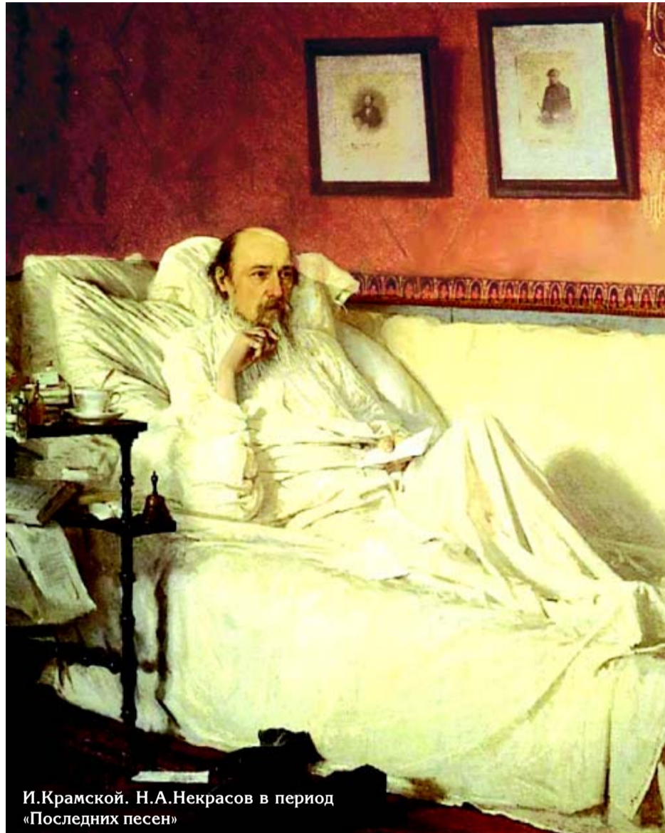
И.Крамской. Н.А.Некрасов в период «Последних песен»

«Некрасов никогда, ни перед кем и ни в чём, не оправдывался: он только просил прощенья. Родине, друзьям, врагам, любимой женщине он говорил “прости!” “Прости” было и последним, невнятно прошёптаным словом его перед кончиной. Как лирическое зак-