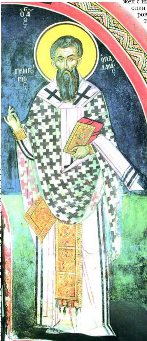
Святитель Григорий Палама в традиционных святительских одеждах.

Чуть позже одна за другой три епархии Элладской Церкви отлучили от Церкви всех местных депутатов, проголосовавших за узаконивание содомии. Первой это сделала Пирейская митрополия, за ней последовали Китирская и Антикитирская митрополия, а также Керкирская, Паксийская и Диантонийских островов митрополия.