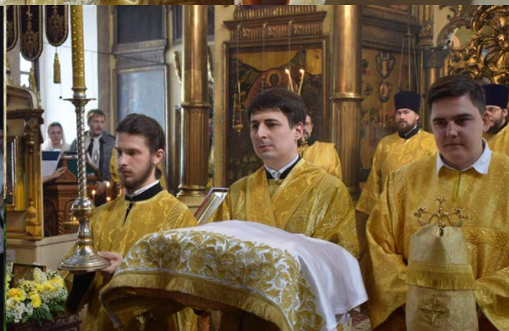
Праздничная литургия в честь Святителя Николая (храм в честь Святителя Николая, архиепископа Мир Ликийских (Никола-Козинская церковь) 22.05.2021)