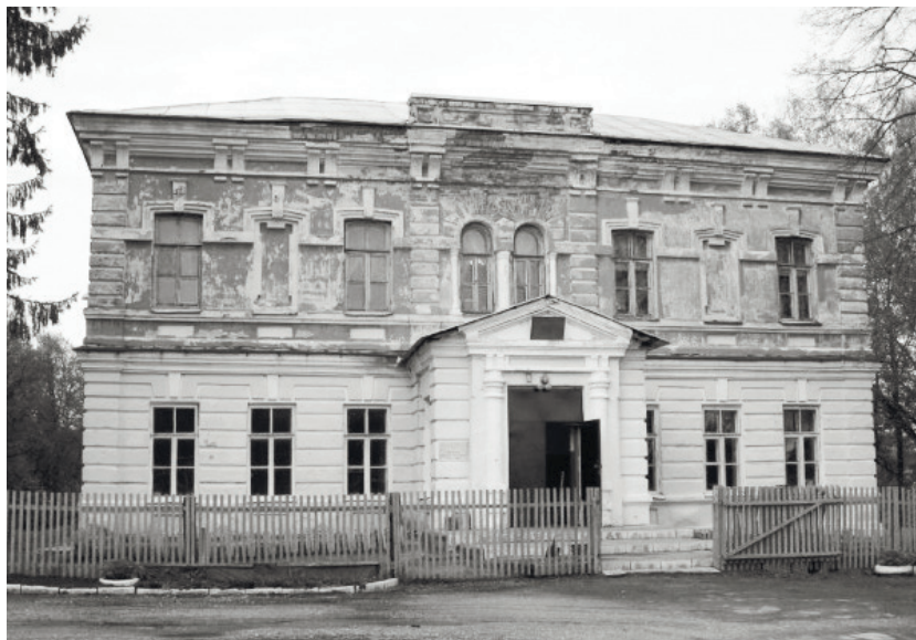
Школа в с. Сашкино