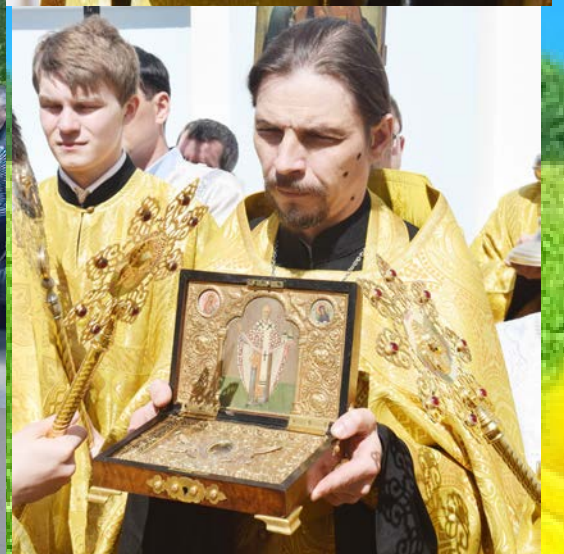
Праздничная литургия в честь Святителя Николая (храм в честь Святителя Николая, архиепископа Мир Ликийских (Никола-Козинская церковь) 22.05.2021)