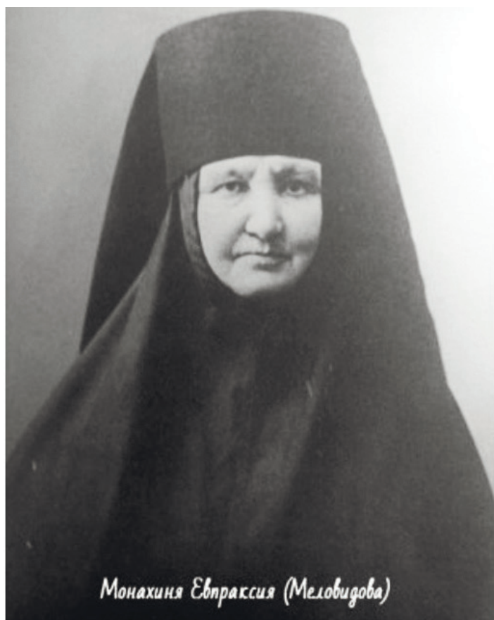
Монахиня Евпраксия (Миловидова)

В прошлом, 2020, году отмечалось 180-летие со дня рождения первой настоятельницы Святой Елеонской обители – матушки Евпраксии (Миловидовой). А в августе сего года исполняется ровно 115 лет со дня учреждения на Елеонской Святой Горе в Иерусалиме женской русской монашеской обители – нынешнего ставропигиального женского Елеонского русского монастыря в юрисдикции РПЦЗ Московского патриархата.