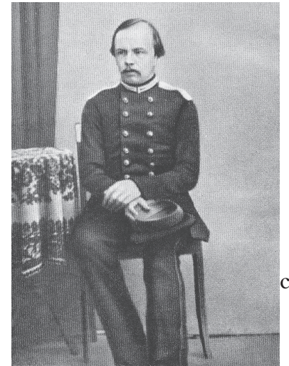
Ф. М. Достоевский. 1859 г.

Третья «ода» «На коронацию и заключение мира» (1856), сопровождаемая просьбой корпусного командира о предоставлении Достоевскому права печататься, тоже была отправлена в Петербург. Только на сей раз автор наметил, чтобы стихи непременно попали и к герою севастопольской обороны генерал-адъютанту Эдуарду Ивановичу Тотлебену. Фёдор Михайлович познакомился с ним давно, когда в 1841 году жил на одной квартире с его младшим братом Адольфом, тоже учащимся офицерского класса Инженерного училища. Да, прошло столько лет! Поэтому и попросил барона Врангеля передать письмо Тотлебену лично в руки. «Если же Вы по лицу его увидите, – наставлял он своего верного друга, – что он займётся мною и выкажет много участия и доброты, о, тогда будьте с ним совершенно откровенны; прямо, от сердца войдите в дело; расскажите ему обо мне и скажите ему, что его слово (подчёркнуто Достоевским – Г.К.) теперь много значит, что он мог бы попросить за меня у монарха, поручиться (как знающий меня) за то, что я буду вперёд хорошим гражданином, и, верно, ему не откажут». «Нельзя ли будет, – спрашивает он далее, – пустить в ход стихотворение?».