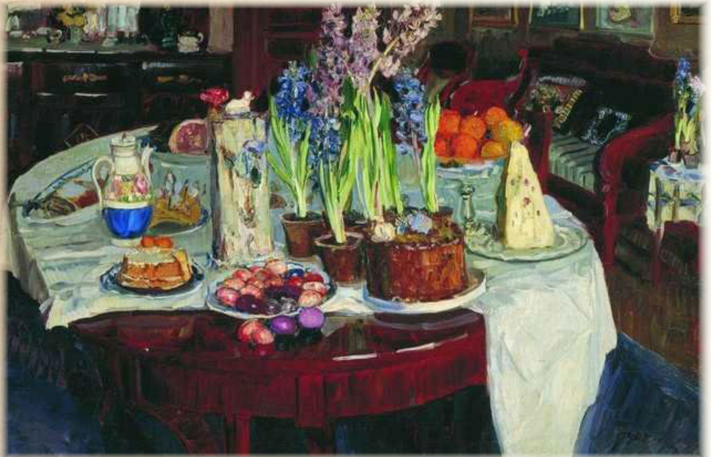
С. Ю. Жуковский «Пасхальный натюрморт»