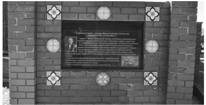
Памятная доска у храма