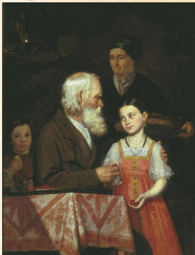
М. А. Мохов «Пасха»