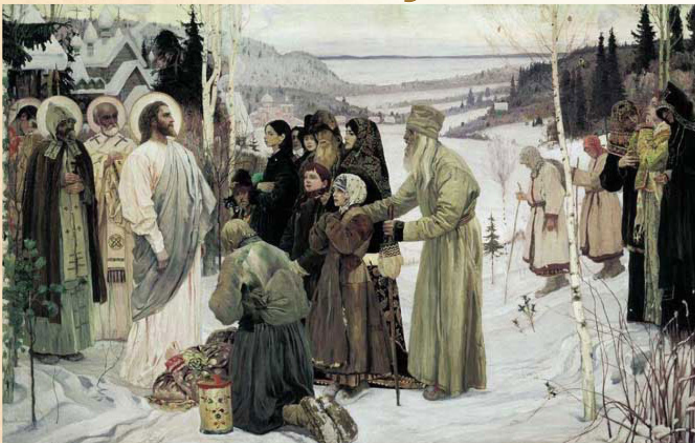
М. В. Нестеров «Святая Русь»