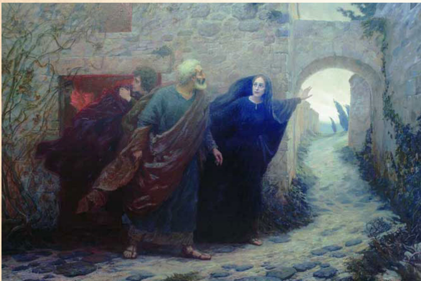
Е. А. Демаков «Утро Воскресения Господня»