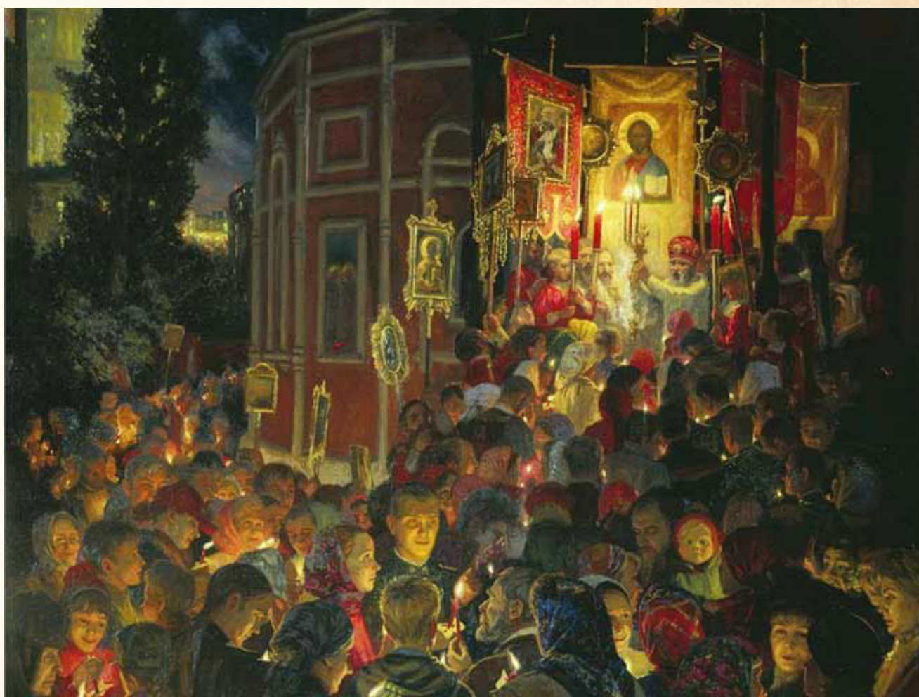
Ю. А. Кузенкова «Пасха»