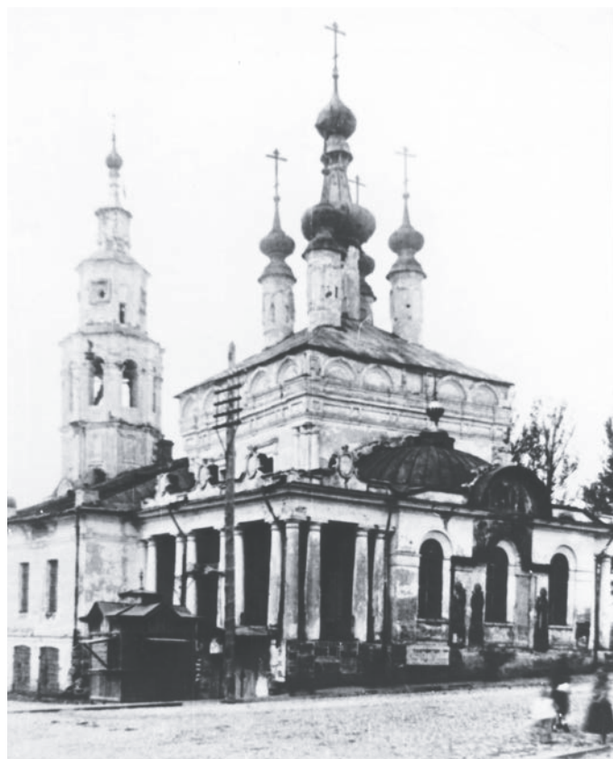
Церковь Никиты Мученика