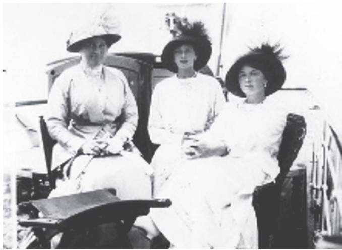
Баронесса С. Буксгевден, Великая княжна Татьяна и Великая княжна Ольга

волюционную власть, на что она ответила: «Я не предаю своих друзей».