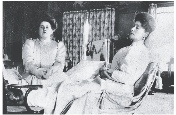
Императрица Александра Фёдоровна и Анна Александровна Вырубова (слева)