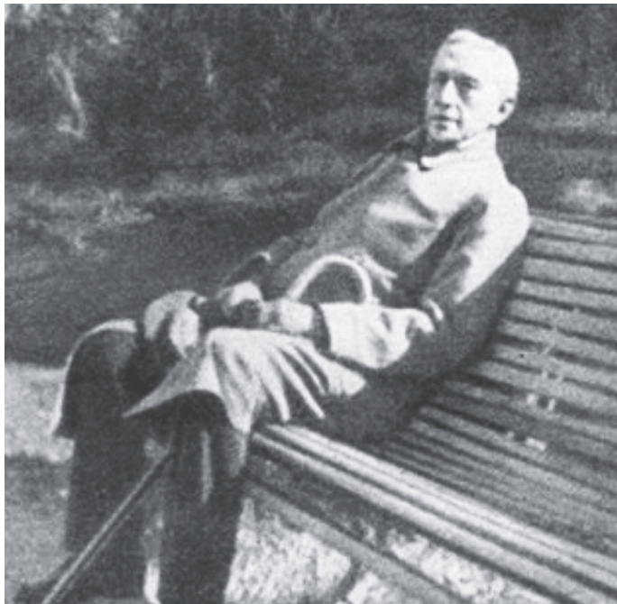
И.А. Бунин в последние годы жизни

Основные темы и мотивы творчества Ивана Алексеевича Бунина (1870–1953) – православная духовность, Россия, её природа и судьба, христианский дух земли русской, национальный характер, загадка русской души, человек и мироздание, любовь и тайны бытия, вечные проблемы жизни и смерти, уходящие корнями в сакральный текст Священного Писания.