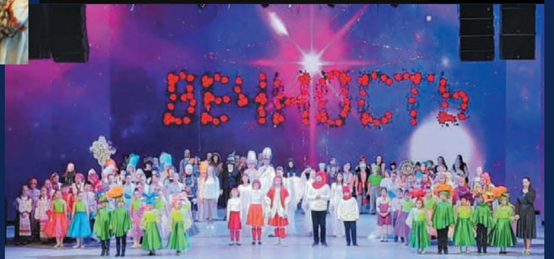
Фото к статье «Рождество Христово - основа воспитания православного христианина», стр. 14