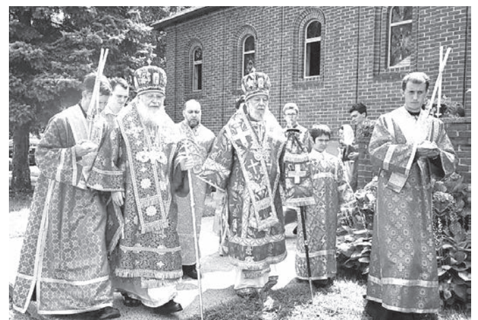
Первоиерарх РПЦЗ митрополит Иларион (Капрал) и епископ Иероним (Шо) на крестном ходе. 2021 г.

После принятия монашеского сана с именем блаженного Иеронима Стридонского, покровителя ли-